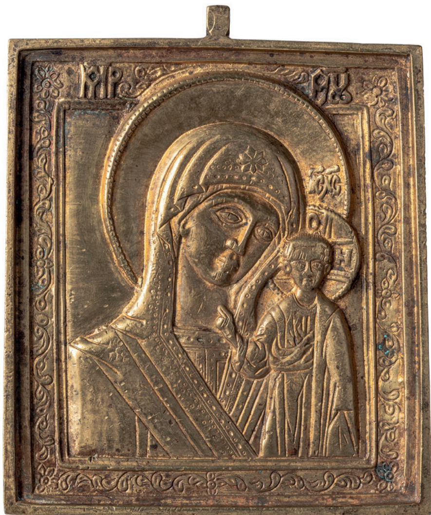
Рис. 6. Богоматерь с Младенцем (Казанская). Икона. 1809/1810 г. Москва (Калуга). Музей русской иконы.